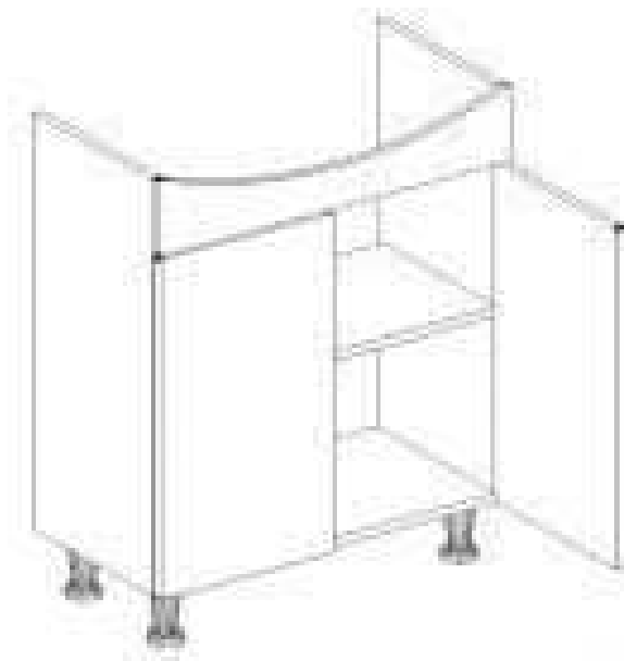
Rys. 3 Poglądowy wygląd szafki pod umywalkę