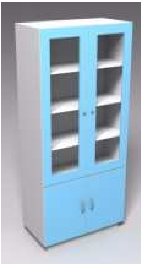
Rys. 4 Poglądowy wygląd szafki na szkło laboratoryjne