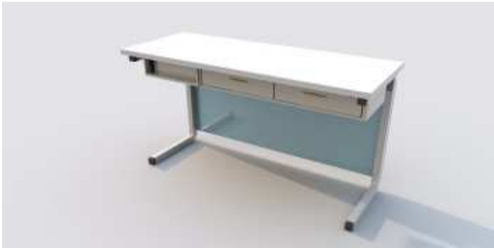
Rys. 2 Poglądowy wygląd stolika uczniowskiego